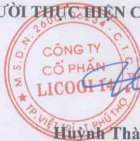
Huỳnh Thành Hậu